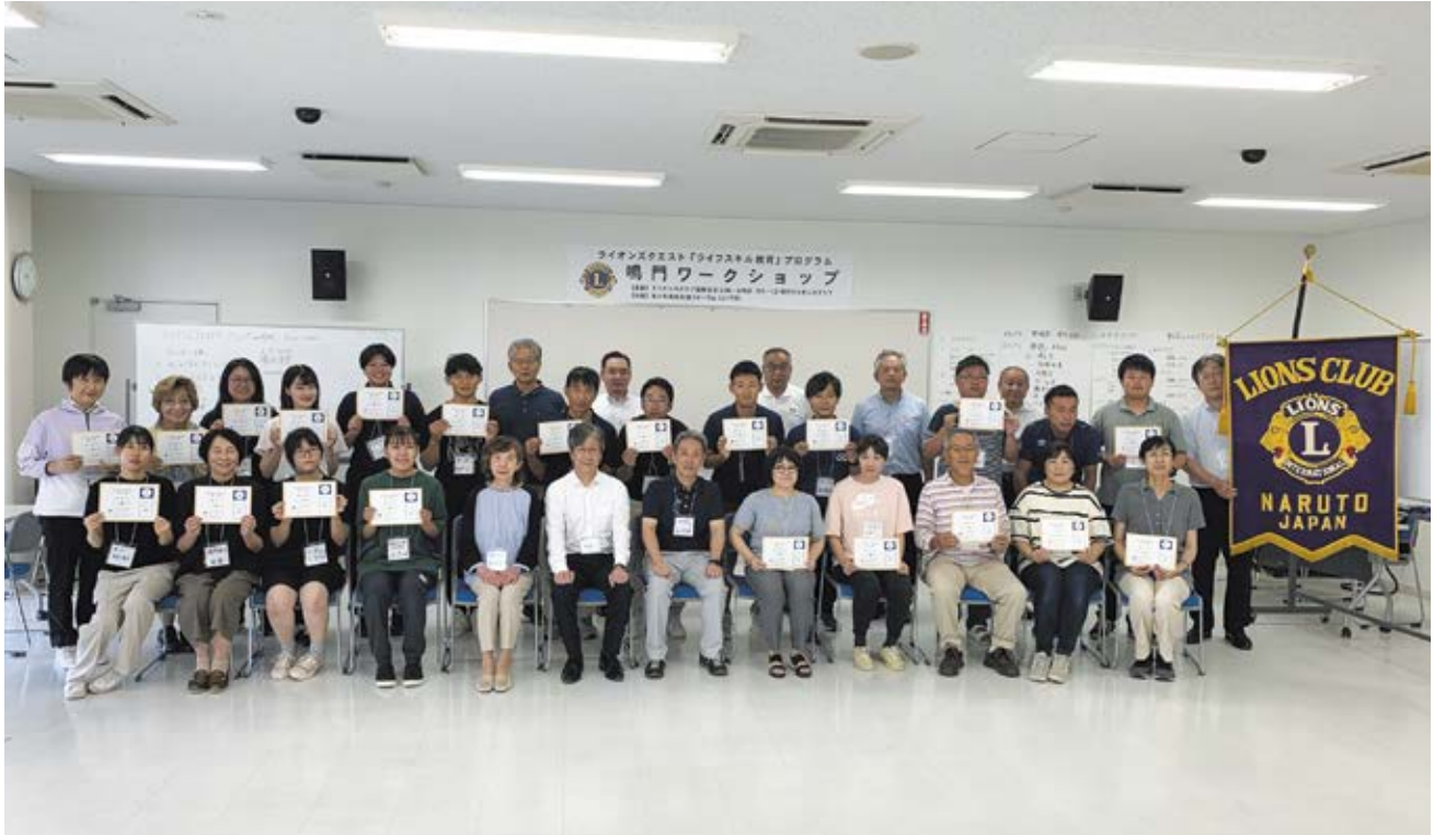
8月20日(火)ライオンズクエスト「鳴門ワークショップ」 場所：鳴門市消防署