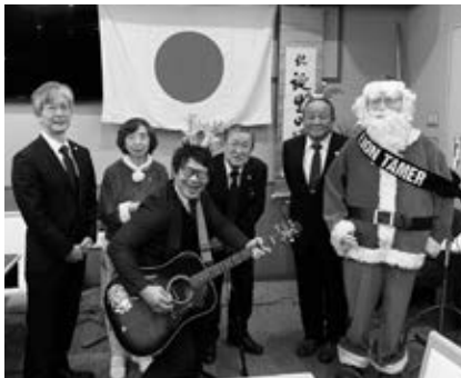
「クリスマス例会」 場所 ホテル・ファーストシーズン

○第一例会：12月2日(土)寿し辰において12月第一例会を開催しました。市内中心街での忘年例会の開催は数年ぶりのことです。例会セレモニーで理事会決議事項の承認や委員会報告などを行った後、懇親会を開催しました。幹事とテールツイスターが中心となって余興で会場を盛り上げてくれました。今年度も前半が終了しようとしています。皆さんありがとうございます。後半も引き続き宜しくお願いいたします。