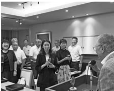
「ゲスト卓話」 場所 ホテル・ファーストシーズン