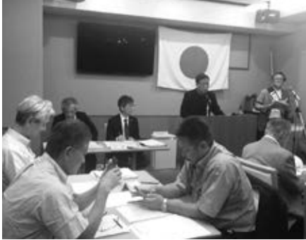
「各委員会方針」 場所 ホテル・ファーストシーズン