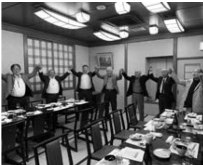
「忘年例会」 場所 寿し辰