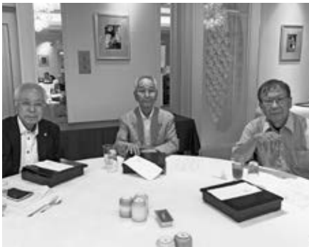
「阿波踊り例会」 場所 アオアヲナルトリゾート