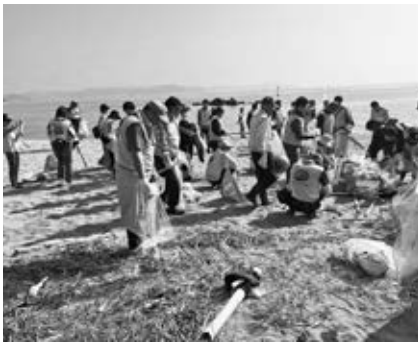
「奉仕例会」 場所 網干海岸