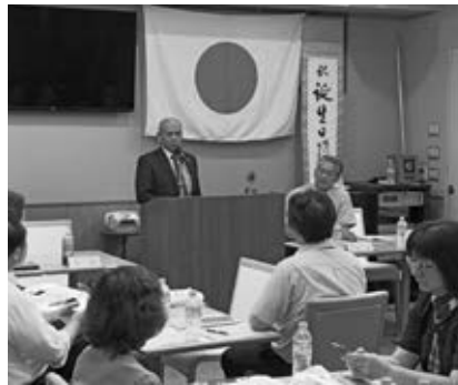
「RC・ZCクラブ訪問」 場所 ホテル・ファーストシーズン