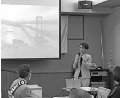
「ゲスト卓話」 場所 ホテル・ファーストシーズン